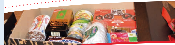
Zu Weihnachten: Wichtige Grundnahrungsmittel sowie Lebkuchen

Auf Wunsch eines Stifters brachte die Bürgerstiftung das Naherholungsgebiet „Reuthgraben“ auf Vordermann. Das natürliche Gleichgewicht der Klamm zwischen Lohmühle und Horbach wurde dabei erhalten, die Wege an verschiedenen Stellen eingeebnet und trockengelegt. Eine neue Sitzgruppe schafft Aufenthaltsqualität und lädt ein, den Blick über den Wasserlauf schweifen zu lassen.