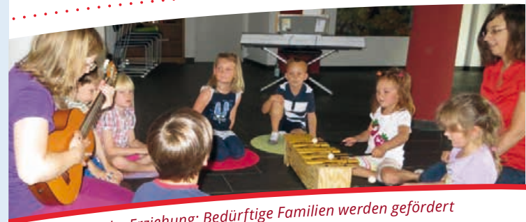
Musikalische Erziehung: Bedürftige Familien werden gefördert

In Deutschland gibt es Lebensmittel im Überfluss – und dennoch herrscht bei vielen Menschen Mangel. Die Tafeln schaffen hier einen Ausgleich. Den Einrichtungen ist es verboten, von den eingehenden Spenden Lebensmittel zu erwerben. Deshalb hat die Bürgerstiftung Lebensmittel besorgt und an die Langenzener Tafel e.V. weitergegeben. Gespendet wurden wichtige Grundnahrungsmittel wie Mehl, Zucker und Öl, die nur selten an die Einrichtung gehen.