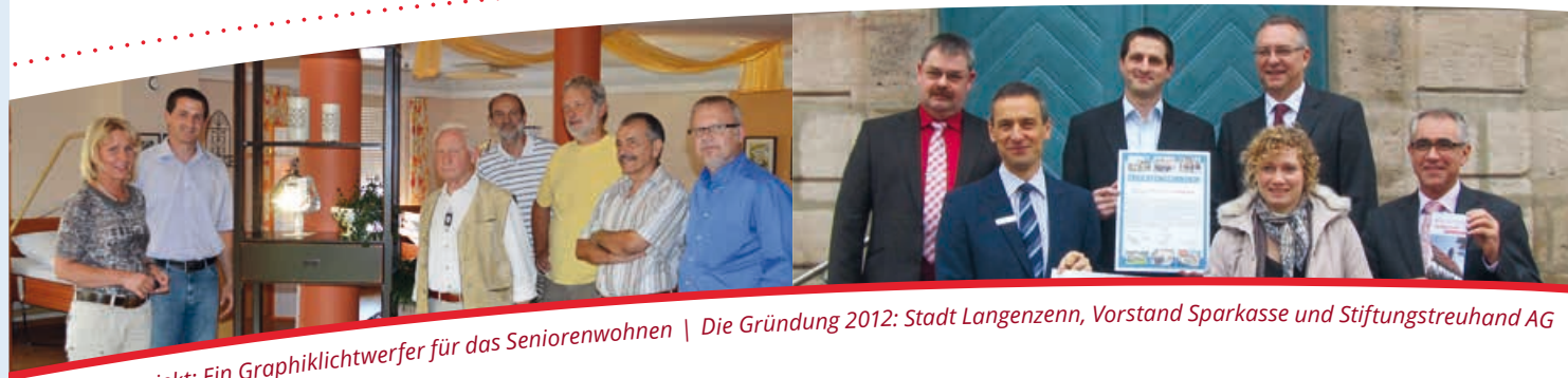
Das erste Projekt: Ein Graphiklichtwerfer für das Seniorenwohnen | Die Gründung 2012: Stadt Langenzenn, Vorstand Sparkasse und Stiftungstreuhand AG