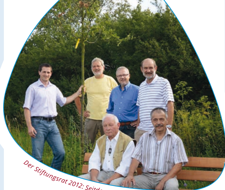
Der Stiftungsrat 2012: Seitdem wächst das Stiftungsbäumchen

Im Fokus eines der ersten Projekte der Bürgerstiftung standen schwer demenzkranke Bewohner des AWO-Seniorenheims in Langenzenn. Der Stiftungsrat schaffte für die Pflegeoase des Wohnheims einen Graphiklichtwerfer an. In einer angenehm gestalteten Raumatmosphäre, die eine Überreizung ausschließt, werden gezielt Sinnesempfindungen ausgelöst. Angenehme Bilder, Düfte, Klänge, Musik und farbiges Licht ermöglichen Erfahrungen in unterschiedlichen Wahrnehmungsbereichen. Mithilfe des neuen Graphiklichtwerfers können bewegte Bilder an die Wand projiziert werden.