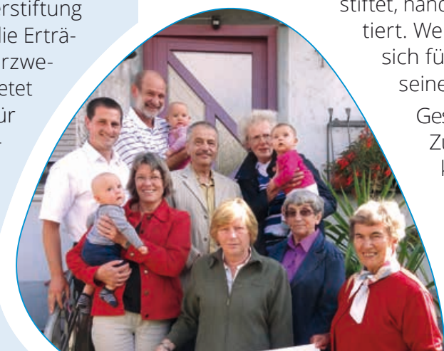
Großfamilie: Finanzielle Hilfe und Nachbarschaftshilfe

Im Unterschied zu herkömmlichen Stiftungen wird das Stiftungskapital einer Bürgerstiftung von mehreren Stiftern aufgebracht, die Erträge können in eine Vielzahl von Förderzwecken fließen. Unsere Bürgerstiftung bietet nun jedem Bürger, der sich gerne für seine Heimatstadt engagieren möchte, eine Möglichkeit, aktiv zu werden. Jeder kann Stifter werden. Auch Unternehmen bietet die Bürgerstiftung eine Möglichkeit, an ihrem Standort in Aktion zu treten.